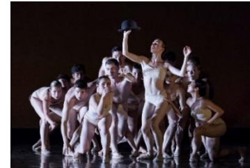
More from "CHAPLIN"